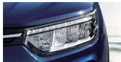
Full LED 헤드램프