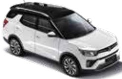
루프 & 리어 스포일러 : 블랙 바디컬러 & 아웃사이드 미러 : 그랜드 화이트