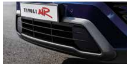
에어로 인테이크 홀