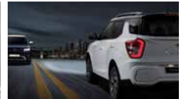
스마트 하이빔 HBA