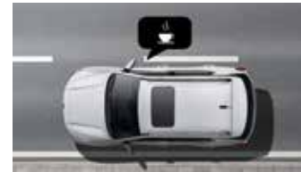
부주의 운전경보 DAA