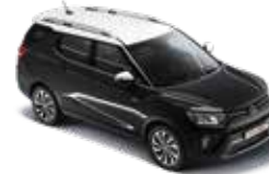
루프 & 리어 스포일러 & 아웃사이드 미러 : 화이트 바디컬러 : 스페이스 블랙