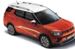
루프 & 리어 스포일러 & 아웃사이드 미러 : 화이트 바디컬러 : 오렌지 팝