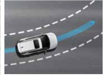
중앙차선 유지보조 CLKA