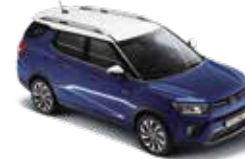
루프 & 리어 스포일러 & 아웃사이드 미러 : 화이트 바디컬러 : 맨디 블루