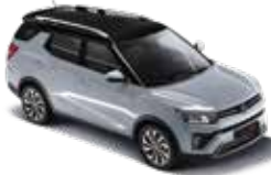
루프 & 리어 스포일러 : 블랙 바디컬러 & 아웃사이드 미러 : 사일런트 실버