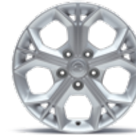
16인치 알로이 휠 (타이어 : 205/65R16)