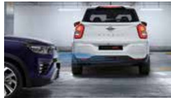
후측방 접근 경보 RCTA 후측방 접근 충돌 방지 보조 RCTAi