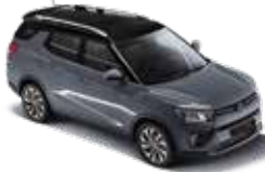
루프 & 리어 스포일러 : 블랙 바디컬러 & 아웃사이드 미러 : 플래티넘 그레이