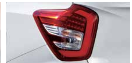
LED 리어 콤비네이션 램프