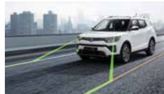
차선 이탈경보 LDWS 차선 유지보조 LKAS