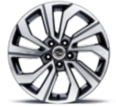
18인치 다이아몬드 커팅 휠 (타이어 : 215/50R18)