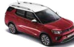
루프 & 리어 스포일러 & 아웃사이드 미러 : 화이트 바디컬러 : 체리 레드