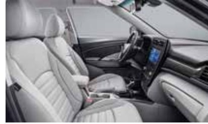
소프트 그레이 인테리어(그레이 헤드라이닝)