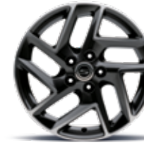
17인치 다이아몬드 커팅 휠 (타이어 : 215/55R17)