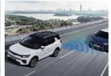
차선변경 경보 LCA 사각지대 감지 BSD