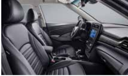
블랙 인테리어(그레이 헤드라이닝)