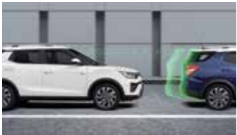
앞차 출발 알림 FVSA

최첨단 주행안전 보조시스템, 딥 컨트롤은 카메라를 통해 주변 상황을 스캐닝하여 예상치 못한 위험 상황에서도 언제나 탑승자가 안전할 수 있도록 도와줍니다.