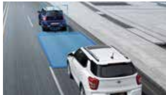
안전거리 경보 SDA