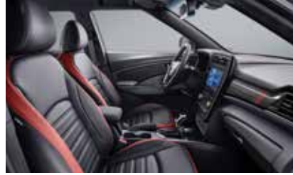
버건디 루튼 인테리어(블랙 헤드라이닝)